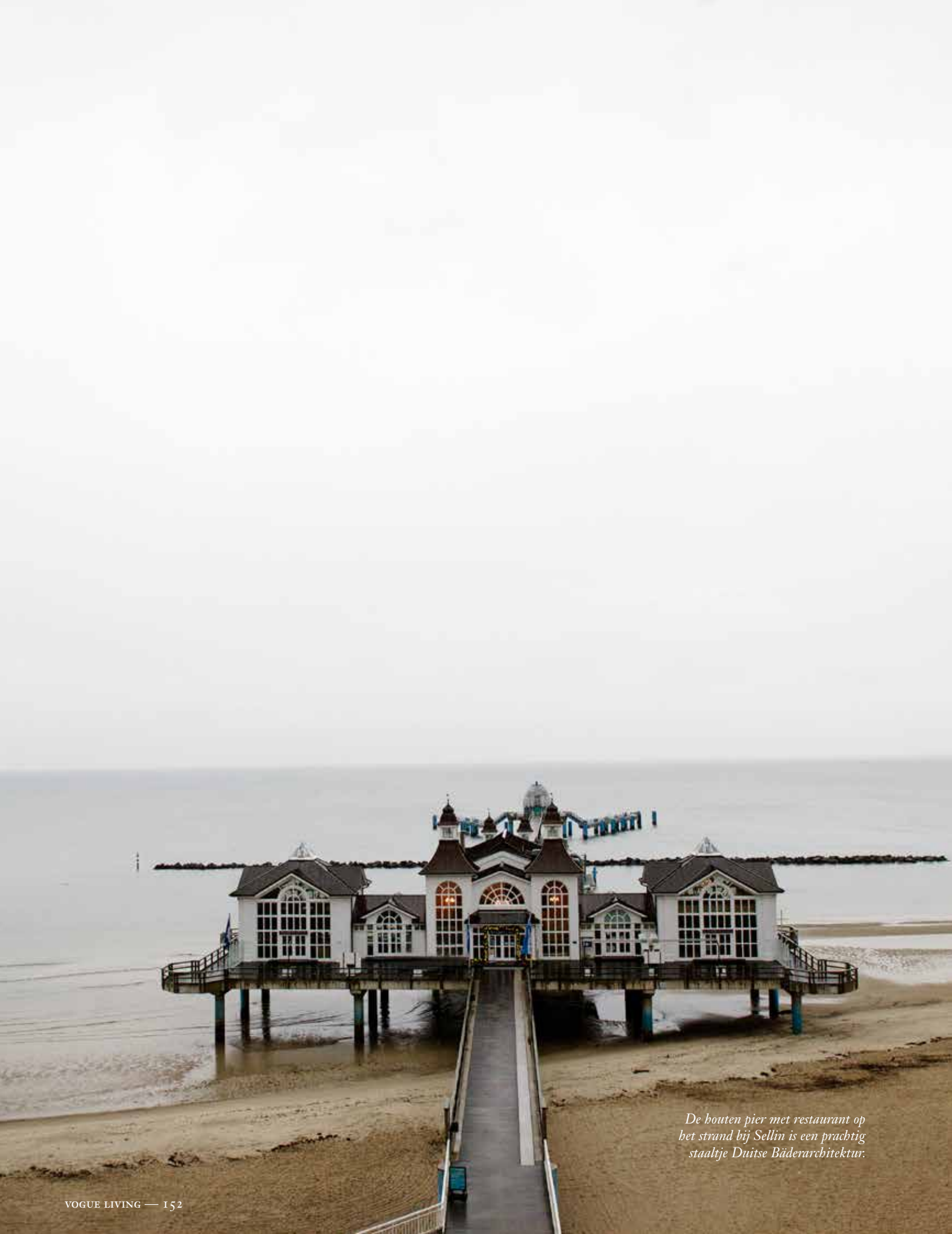
De houten pier met restaurant op het strand bij Sellin is een prachtig staalje Duitse Bäderarchitektur.

De Baltische kust wordt ook wel 'de BADKUIP van Berlijn' genoemd, maar het achterland ligt er vergeten en verlaten bij